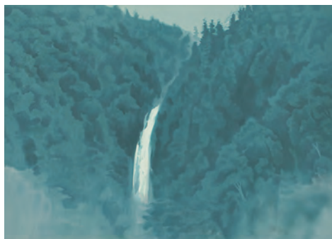
「滝の音」リトグラフ