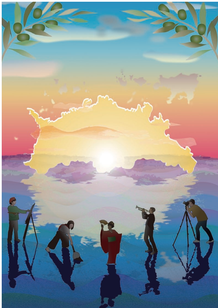
2023年 / 伊藤 芽久美 原画制作