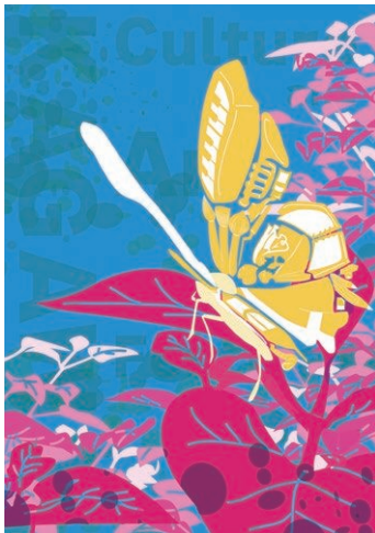
2021年 / 亀井 萌花 原画制作