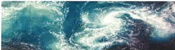
野地美樹子《Uzu-Sio》(全国) 2020年 194x672cm