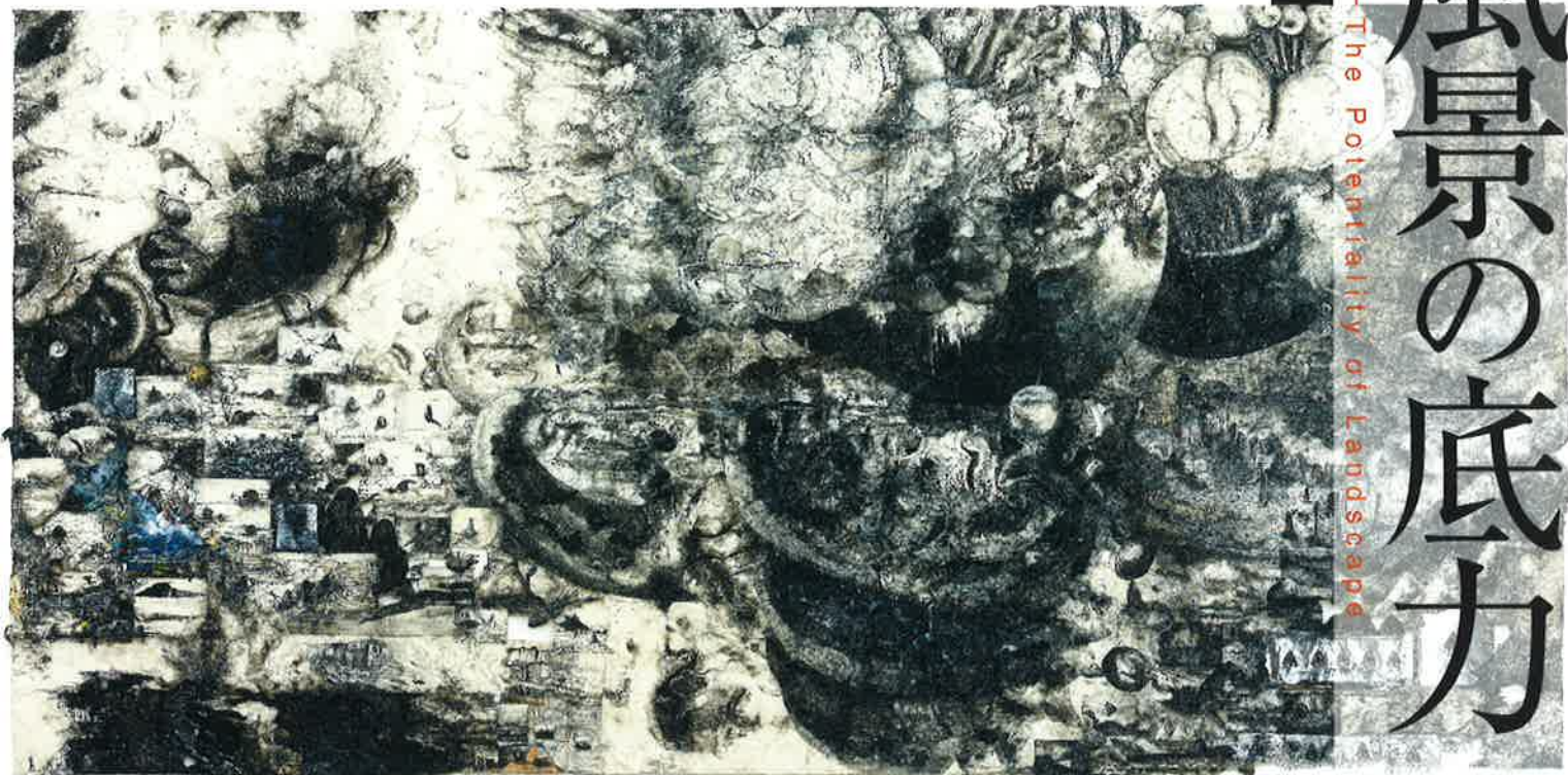
三瀬夏之介 《日本の絵～笑月～》 2013年 363x740cm