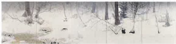
野地美樹子《白冬の森》2017年 162x651.5cm