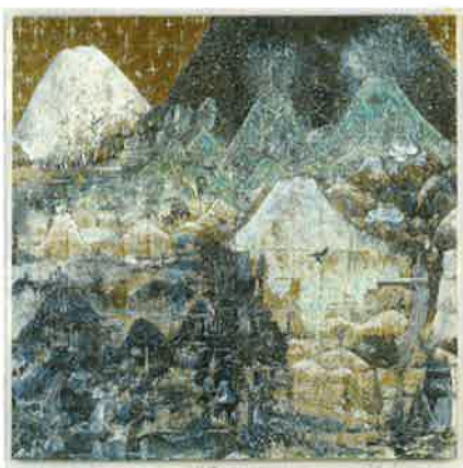
三瀬夏之介 《日本の絵》 2005年 200x200cm 文化庁蔵 東京都現代美術館寄託