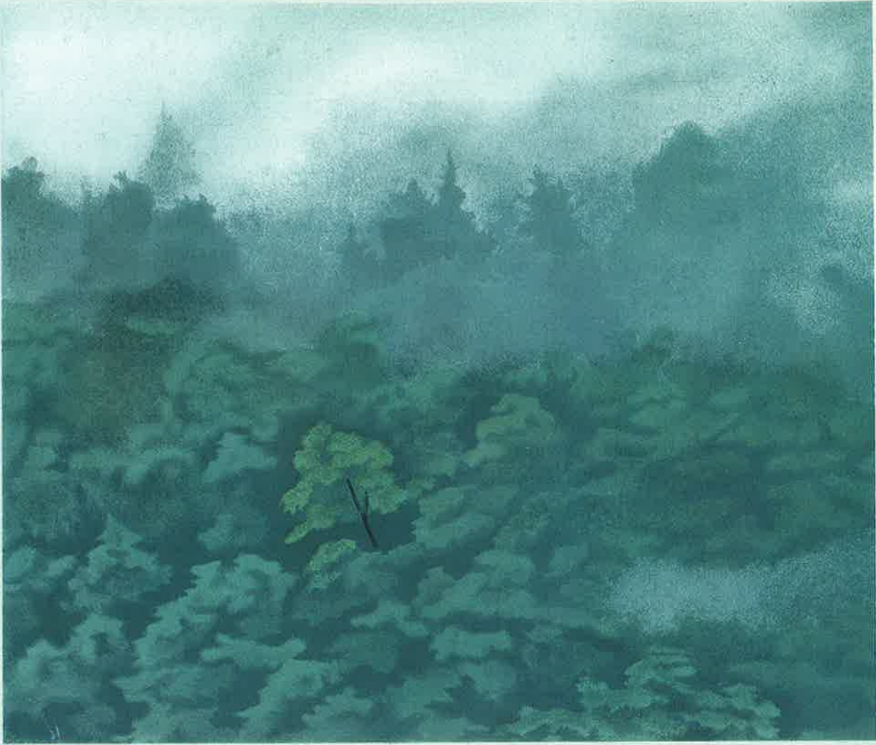
東山魁夷「煙雨」リトグラフ

Kagawa Prefectural Higashiyama Kai Setouchi Art Museum