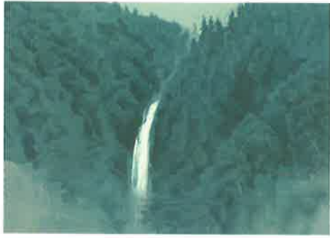
「滝の音」リトグラフ