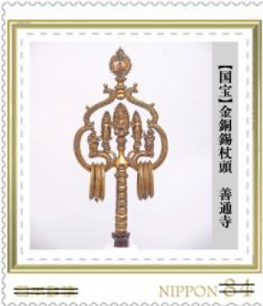
【国宝】金銅錫杖頭 普通寺