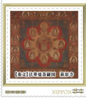
【重文】法華曼荼羅図 萩原寺