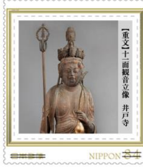
【重文】十面観音立像 井戸寺