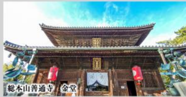
総本山普通寺 金堂