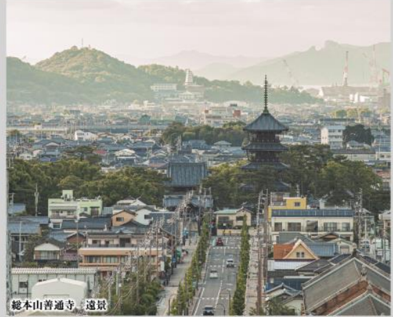
総本山普通寺 遠景