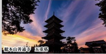
総本山普通寺 五重塔