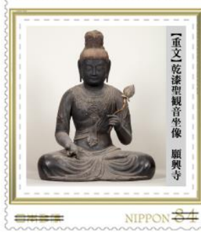
【重文】乾漆聖観音坐像 願興寺