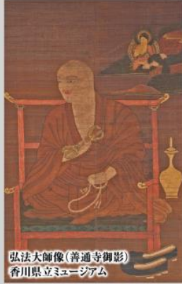
弘法大師像(普通寺御影) 香川県立ミュージアム