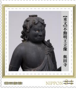
【重文】不動明王立像 奥田寺