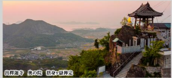
出釋迦寺 奥の院 捨身ヶ嶽禪定