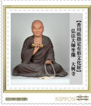
【香川県指定有形文化財】 弘法大師坐像 大興寺