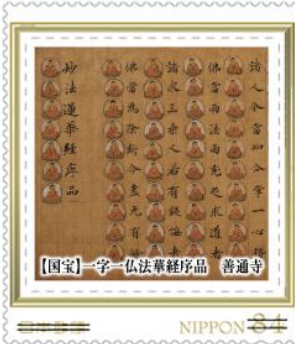
【国宝】一字一仏法華經序品 普通寺