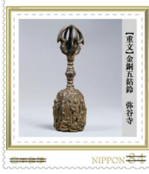
【重文】金銅五骷髏 弥谷寺