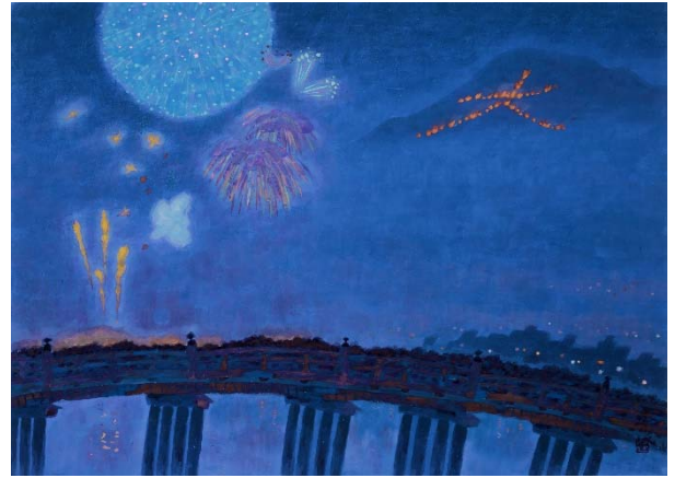
池田遙邨「大文字の送り火」