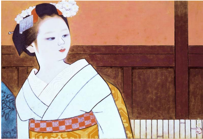
広田多津「祇園の町並」