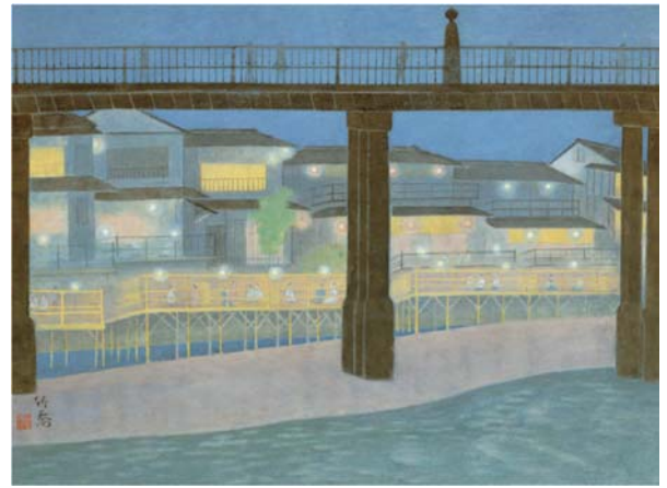
左から 秋野不矩「平安神宮」／小野竹喬「鴨川夜景」 いずれも 1973 年作 京都府蔵（京都府京都文化博物館管理）

うつりゆく京都の風物や景色を日本画に描きとどめて後世に伝えようと、1971（昭和 46）～73（昭和 48）年にかけて京都府が制作委嘱した「京の百景」。文化と自然に富んださまざまな姿をもつ京都を 8 つの地区に分け、京都画壇を代表する日本画家たちによって描かれた作品 118 点から、本展では春の情景を描いた作品など 37 点を特に選りすぐり、ご紹介いたします。街、山、海へと、足をのばして旅するように、50 年の時を超えた多彩な京都をぜひご覧ください。