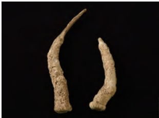
「牛鬼の角」江戸時代、根香寺蔵 特別公開

「おそろしいもん」とは、讃岐弁で「こわいもの」を意味します。この夏秋、当館が収蔵する歴史、美術、民俗の各分野から、こわい、おそろしい、怪しいなどをキーワードに「おそろしいもん」を紹介する特別展を開催します。人々は暗闇をはじめ、理解の範疇を超えた不思議な現象や、抗うことのできない不安、大きな自然の力に恐怖を抱いてきました。本展では、香川県内に残る妖怪に関する貴重な資料、軍記物語などに描かれた悲しいエピソードにまつわる作品、いつ起こるかかわからない恐怖である災害の資料や、災害に影響を受けた絵画など、およそ70件を6つのテーマから紹介します。また、根香寺、金刀比羅宮、香川大学図書館にご協力いただき、貴重な作品や資料をあわせて特別公開します。