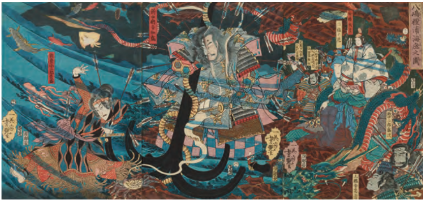
歌川芳艶「八島檀浦海底之図」安政5年(1858) 後期(9/1~10/4)