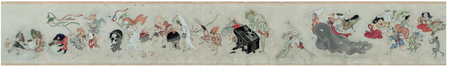
生田久一「百鬼夜行絵」昭和9年(1934)、金刀比羅宮蔵 特別公開 前後期場面替