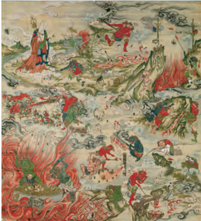
長谷川賢一「地獄図」江戸時代、円明寺蔵 後期(9/1~10/4)