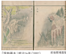
「怪物画本」明治14年(1881) 前後期場面替 香川大学図書館神原文庫蔵 特別公開