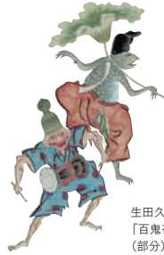
生田久一「百鬼夜行絵」(部分)