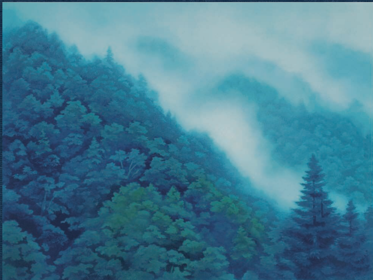
東山魁夷「夏山白雲」リトグラフ

Kagawa Prefectural Higashiyama Kai Setouchi Art Museum