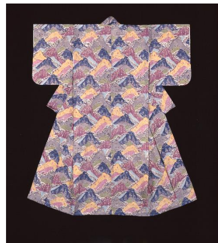
鎌倉芳太郎「型絵段染山水文上布長着」