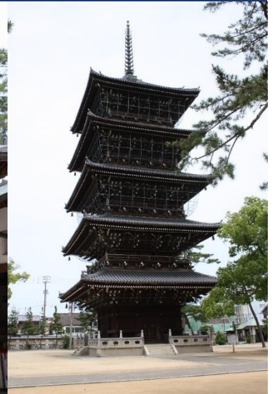
上 五重塔（国指定重要文化財） 左 金堂（国指定重要文化財）