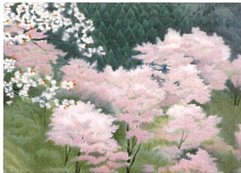
左「東山魁夷祖父 東山新吉像」(部分) 作者不詳 中「道」トグラフ-----青森県八戸市種差海岸(三陸復興国立公園) 右「吉野の春」トグラフ-----奈良県吉野(吉野熊野国立公園) おもて面「朝の内海」-----岡山県鷲羽山からみた櫃石島(瀬戸内海国立公園)