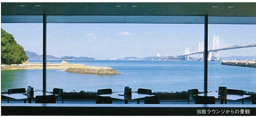
当館ラウンジからの景観