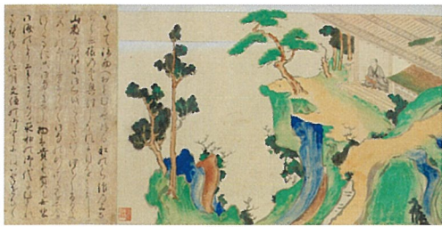
讃岐を訪れた菅原道真や西行、古人の姿