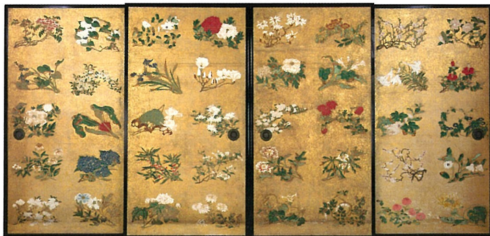
若冲、花の命を描く。修理後、金刀比羅宮の宮外では初めての公開