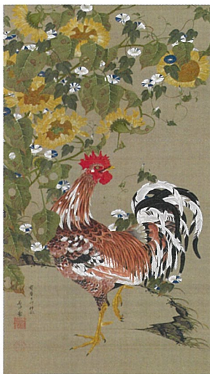
生命の瞬間をとらえる、若冲の真骨頂